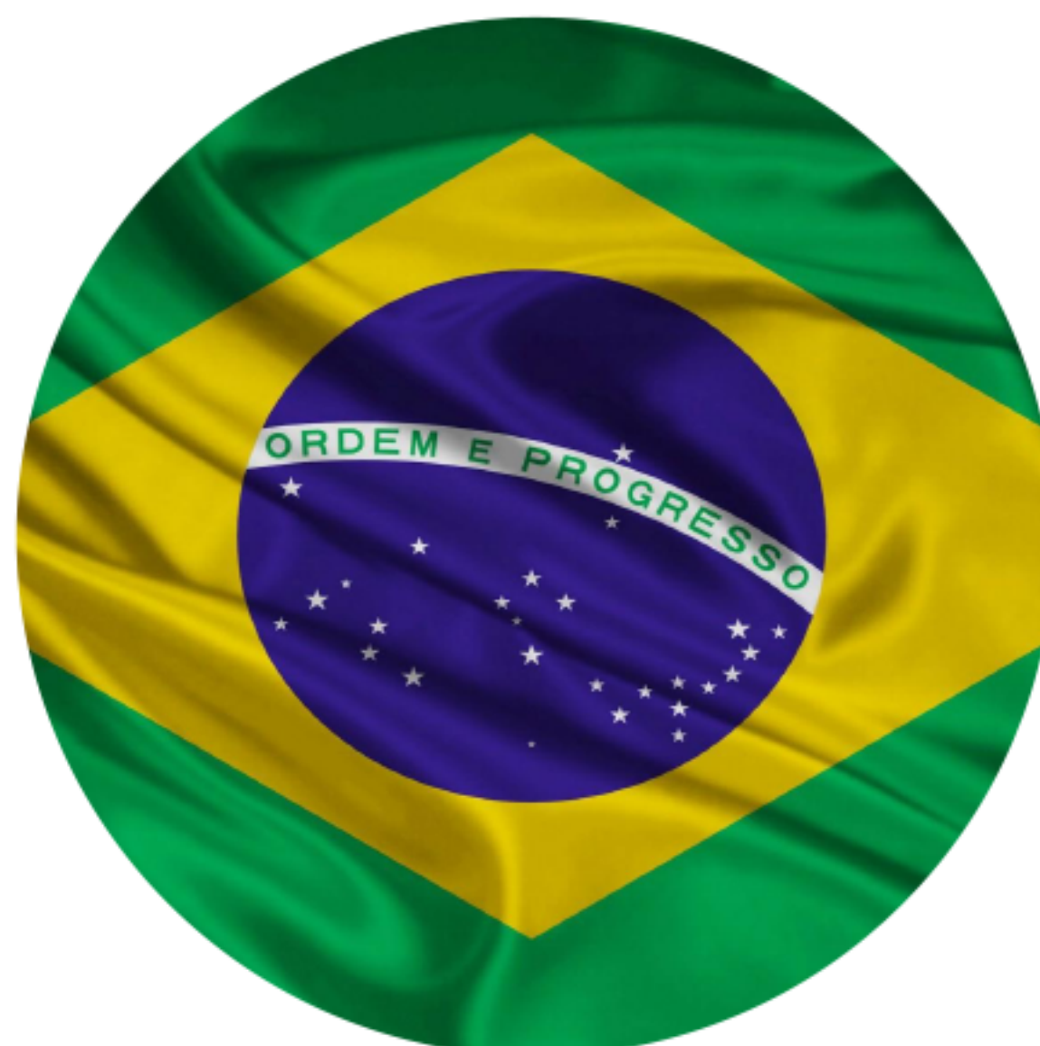
Bandeira do Brasil